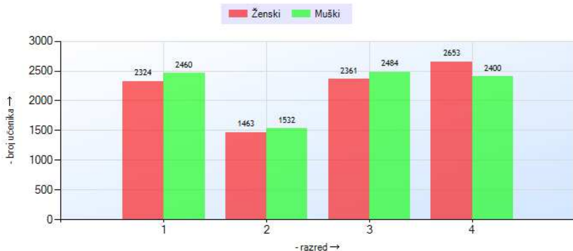
1.1 Grafički prikaz za šk. 2014/15. (I polugod.)